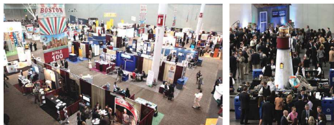
2010 INTA 波士頓會場

亞律為台灣中部地區唯一實務參與 INTA 年會的會員事務所，在這五天密集的活動中，亞律結交了許多新的國際合作伙伴，如美國 (OSPA) Overseas Patent Agency, Inc.、德國 Michalski Hüttermann、印度 (LLS) Lall Lahiri & Salhotra... 等。也帶回許多智產新訊，希望藉由與國外代理人之交流讓亞律的服務更專業，也因此提高台灣的國際能見度。