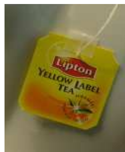
立頓紅茶茶包紙片

舉例而言，立頓紅茶註冊當時，可能會覺得註冊「立頓」、「Lipton」字樣已足，不會想到立頓紅茶袋手握的小紙片圖樣，會在市場上被那麼多人仿冒、抄襲，對商標所有人而言，很難期待立頓紅茶在註冊當時，就該想到那個小標籤也要註冊；又如若企業不認為其一開始使用的標章是一個商標，等到遭到他人仿襲了，才認為應該禁止他人使用。此類型案例就無法透過商標法的適用，來保護權利人的權利，但仍可以透過公平交易法來規範侵害權利人。