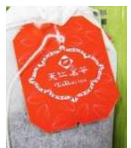
天仁茗茶茶包紙片